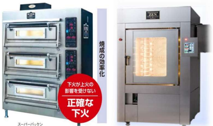
スーパーバッケン スチームラックオーブン